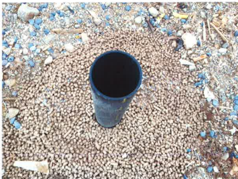
Mynd 3: Gasrör borað þann 30. nóvember 2015 efst í urðunarrein nr. 4. Myndin er tekin 1. desember en þá var ekki búið að ganga frá lokun rörsins.

Sex mánaða seinkun varð á lagningu gasröra til gasmælinga, en það var fyrsta verkefnið í áætluninni. Í lok nóvembermánaðar komu verktakar frá Ræktunarsambandi Flóa og Skeiða og boruðu þrjár holur og munu gasmælingar hefjast í febrúar 2016. Samkvæmt starfsleyfi skal mæla þrýsting og samsetningu hauggass. Á mynd 3 má sjá eitt röranna sem borað var í nóvemberlok en það er ekki fullfrágengið þegar myndin er tekin þann 1. des.