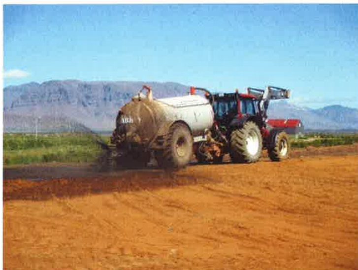
Mynd 2: Unnið að frágangi yfirborðs á urðunarrein nr. 3 á gamla urðunarstaðnum í Fíflholtum (Ljós. Stefán Gíslason 29. júní 2015).

Í fyrirmælum Umhverfisstofnunar um frágang og vöktun eldri urðunarstaðar í Fíflholtum, (þ.e. reina 1-3), kemur fram að til þess að mögulegt verði að rekja uppruna mengunar, annað hvort til eldri urðunarstaðarins eða til þess nýja, sé nauðsynlegt að sigvatnskerfi reina 1–3 verði haldið að fullu aðskildu frá sigvatnskerfi nýja urðunarstaðarins. Vöktun er rakin í umhverfisvöktun UMÍS, Stefáns Gíslasonar, umhverfisstjórnunarfræðings en nú er gefin út vöktunarskýrsla fyrir hvorn stað um sig. Úrdráttur úr skýrslu fyrir starfandi urðunarstað má sjá í kafla 15.