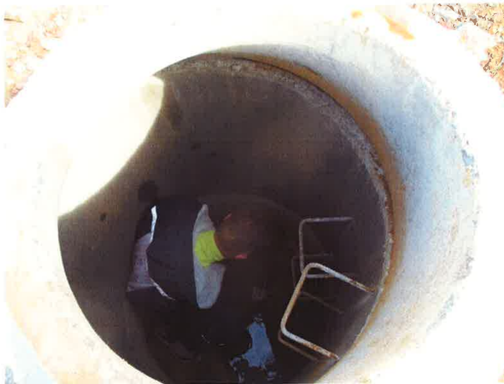
Mynd 6: Sýnataka úr brunni neðst í urðunarreininni í Fíflholtum 2. júní 2015.

Öll sýni voru send samdægurs til Matís ohf. sem sá um að koma sýnum til greiningar. Fyrstu greiningarniðurstöður vegna efnamælinga bárust frá Matís 5. júní, þ.e. mælingar á sýrustigi, leiðni, C.O.D og svifögnum. Aðrar mælingar voru framkvæmdar hjá ALS Scandinavia AB í Svíþjóð. Niðurstöður þeirra mælinga bárust frá Matís 23. júní. Allar niðurstöðurnar eru birtar í Viðauka.