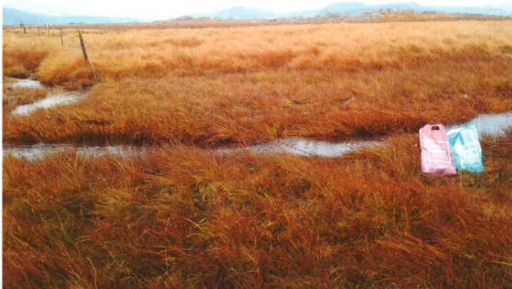
Mynd 7: Við neðri sýnatökustaðinn við Norðlæk 19. október 2015. Plastpokarnir eru ekki rusl, heldur voru þeir notaðir undir sýnatökuilát (Ljósm. S.G.).

Öll sýni voru geymd á köldum stað til næsta dags og þá send til Mátis ohf. sem sá um að koma þeim til greiningar. Fyrstu greiningarniðurstöður vegna efnamælinga bárust frá Mátis 23. október, þ.e. mælingar á sýrustigi, leiðni, C.O.D og svifögnum. Aðrar mælingar voru framkvæmdar hjá ALS Scandinavia AB í Svíþjóð. Niðurstöður þeirra mælinga bárust frá Mátis 2. nóvember. Allar niðurstöðurnar eru birtar í Viðauka, ásamt með niðurstöðum úr greiningum frá því í júní.