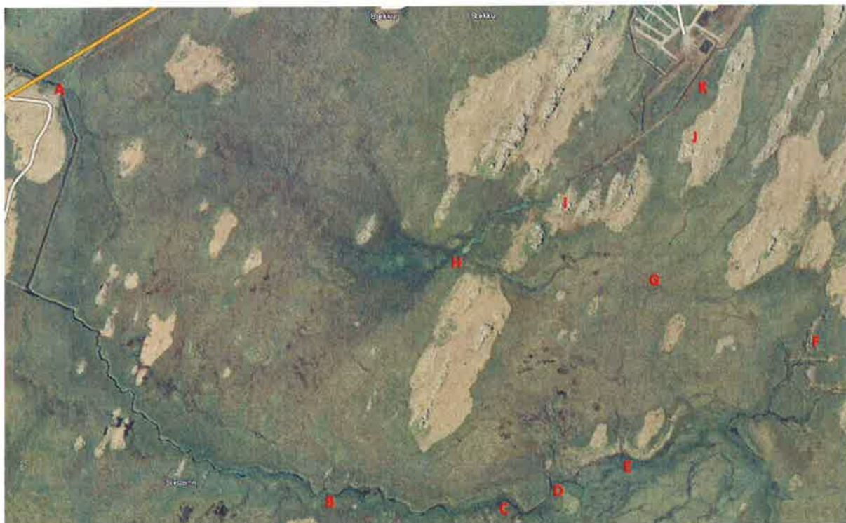
Mynd 5: Loftmynd af mýrinni sunnan og suðvestan við urðunarstaðinn í Fíflholtum. Bókstafurinn „K“ merkir hlið á girðingu, „J“ táknar efri grunnvatnsborholuna og „I“ þá neðri. Norðlækur er neðst á myndinni (merktur með A, B, C, D, E og F, talið neðan frá). (Byggt á loftmynd af ja.is).

Auk þeirra mælinga sem hér hefur verið getið um eru upplýsingar um veður skráðar mánaðarlega, svo og upplýsingar um aðra þætti sem taldir eru geta skipt máli við túlkun niðurstaðna. Mælingar eru að jafnaði gerðar á tímabilinu frá kl. 8.30-12.00 árdegis og stuðst við veðurathuganir á sömu tímum frá sjálfvirkri veðurstöð Veðurstofu Íslands í Fíflholtum.