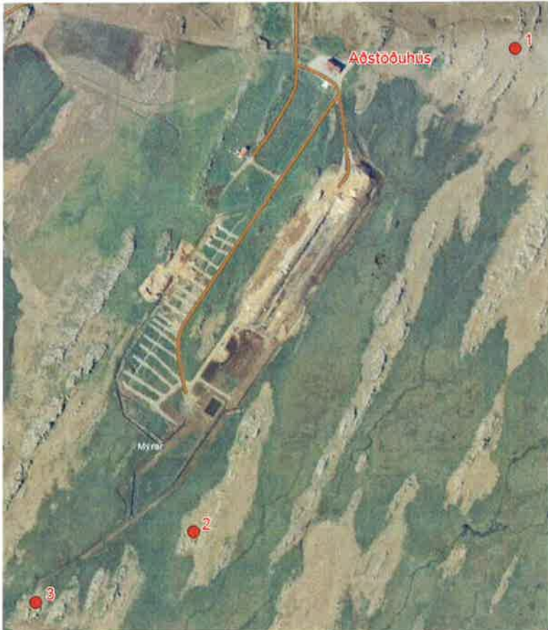
Mynd 4: Staðsetning á grunnvatnsborholum í Fíflholtum.

að ná sýnum en djúpt er niður á grunnvatn á þessum stöðum. Grunnvatnsstaða í þessum holum er jafnframt mæld tvisvar á ári í samræmi við ákvæði starfsleyfis. Staðsetning holanna (nr. 1-3) er sýnd í grófum dráttum á mynd 4. Myndin er byggð á gamalli loftmynd sem sýnir aðeins eldri urðunarstaðinn sem nú hefur verið lokað. Nýi urðunarstaðurinn liggur austan (hægra megin) við þann eldri og útrásarskurður frá honum opnast út í mýrina austan (hægra megin) við klapparholtið sem borhola nr. 2 er staðsett í (sjá mynd 4).